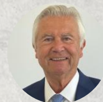
Jean-Pierre GRAND Sénateur de l'Hérault, Maire Honoraire de Castelnaud-le-Lez