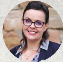
Gaëlle LEVEQUE Maire de Lodève