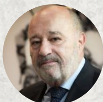
Jean-Michel BAYLET Maire de Valence d'Agen, Président de la Communauté de Communes des Deux Rives