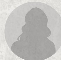
Delphine LABAILS Maire de Périgueux