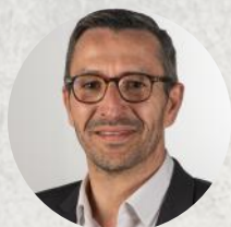
Michel ARROUY Maire de Frontignan

du Manifeste des élus et élus engagés pour le monde nouveau