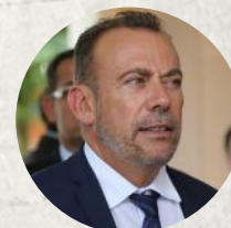
Marc GRICOURT Maire de Blois