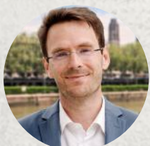
Nicolas MAYER-ROSSIGNOL Maire de Rouen, Président de la Métropole Rouen Normandie