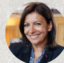
Anne HIDALGO Maire de Paris