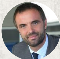
Michaël DELAFOSSE Maire de Montpellier, Président de Montpellier Méditerranée Métropole