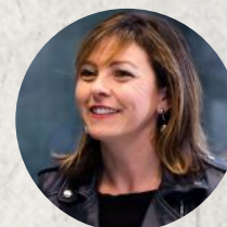
Carole DELGA Présidente de la Région Occitanie/Pyrénées- Méditerranée, Présidente des Régions de France