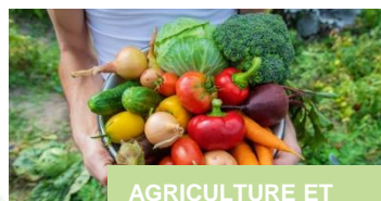
AGRICULTURE ET ALIMENTATION