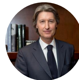
Jean-Charles Decaux Président du Directoire & Co-Directeur Général de JCDecaux SA