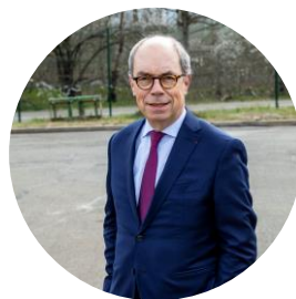
Pierre Coppey Président de Vinci Autoroutes