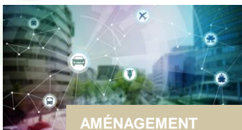
AMÉNAGEMENT ET MOBILITÉ