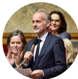
Loïc Dombrev Vétérinaire, Député, Auteur de la loi sur l'amélioration du bien-être animal